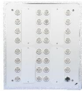
KNX-TAB 31 Aluminium eloxiert