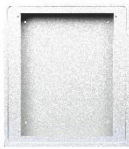
Gehäuse APAL 32