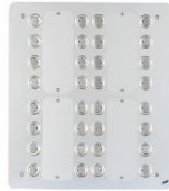
KNX-TAB 31 Aluminium eloxiert